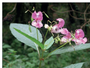
Balsamine de l'Himalaya

Plante exotique envahissante Si vous la croisez, arrachez-la !