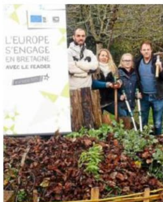
Quatre animatrices de l'accueil de loisirs sans hébergement ont participé au stage à La Chapelle-Neuve.