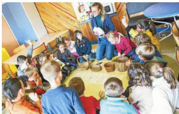
Les enfants ont commencé par une présentation en salle.

Au programme de ce jeudi, découverte du rôle des vers de terre dans la vie du sol, saisonnalité des fruits et légumes et travaux pratiques de préparation des carrés de potager qui seront semés la semaine prochaine. Le tout dans la bonne humeur et en s'amusant. Du coup, pour les enfants : « Ça passe trop vite ». Du côté de