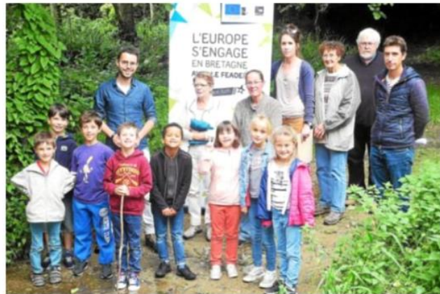
Se montrer curieux et connaître la rivière par le jeu : c'est tout l'intérêt du projet Territoire d'eau de l'Europe et du Bassin versant-Vallée du Léguer.

Ces ateliers pédagogiques, inscrits aux temps d'activités périscolaires des communes du Bassin-versant du Léguer, sont proposés aux com-