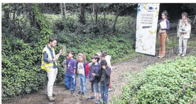
Les écoliers de Pluzunet ont inauguré un cycle d'ateliers ouverts à toutes les communes.

compétentes, le Centre d'Initiation à la rivière et le Centre Forêt Bocage, les enfants qui participent aux Tap suivent des ateliers autour de trois thématiques : le bocage, le jardinage au naturel et les cours d'eau-économies d'eau.