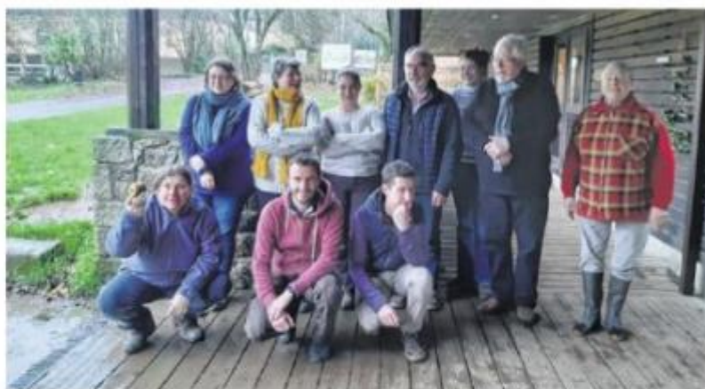
Animateurs, formateurs et représentants du Bassin Versant Vallée du Léguer réunis au Centre forêt bocage, à La Chapelle-Neuve.

La formation va permettre aux animateurs d'encadrer eux-mêmes ces ateliers par la suite. « L'objectif était d'avoir un réseau d'animateurs autonomes et compétents qui assurent sur le long terme