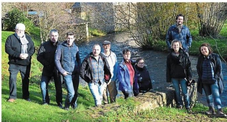
Former des animateurs permet d'avoir un impact plus important sur la préservation du milieu naturel.

Un enseignement décliné en trois thèmes : bocage, jardinage naturel et cours d'eau et économie de l'eau. En tout, 266 enfants ont participé à des